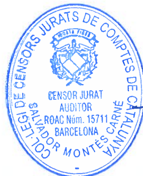
Quim Sicília President

No obstant l'assenyalat en el paràgraf anterior, els dèbits per operacions de les activitats amb venciment no superior a un any i que no tinguin un tipus d'interès contractual, així com les fiances i els desemborsaments exigits per tercers sobre participacions, el import dels quals s'espera pagar a curt termini, es poden valorar pel seu valor nominal, quan l'efecte de no actualitzar els fluxos d'efectiu no sigui significatiu.